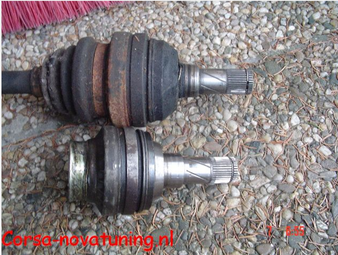
Op bovenstaande foto zie je het verschil tussen een standaard 2.0 homokineet (de bovenste) en een diesel homokineet.

Alleen als er een F16 is gemonteerd aan het blok.