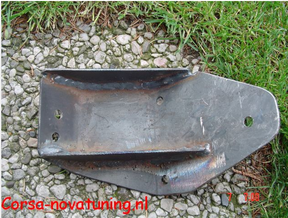
Op bovenstaande foto is de motorsteun te zien.